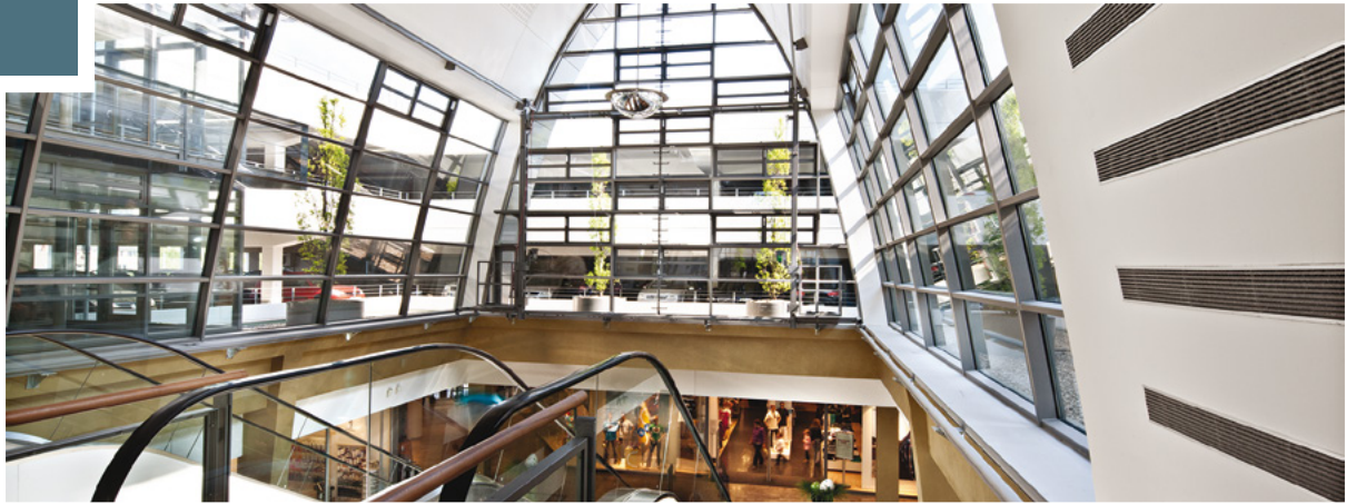
Rheinberg Galerie, Bergisch Gladbach; WestInvest TargetSelect Shopping

Unser Lösungsangebot für institutionelle Investoren umfasst Immobilien-Spezialfonds, Immobilien-Publikumsfonds sowie individuelle Fondslösungen, die exakt an die spezifischen Bedürfnisse institutioneller Anleger angepasst werden.